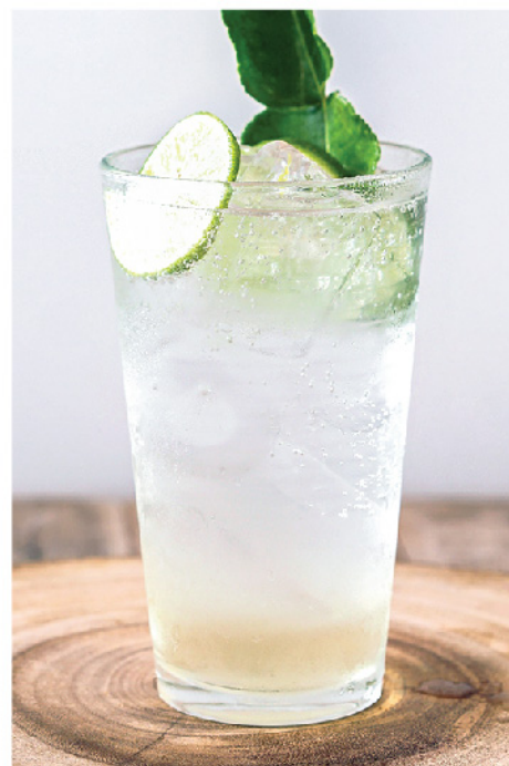
มะกรูดโซดา 95.- Kaffir Lime Syrup Soda