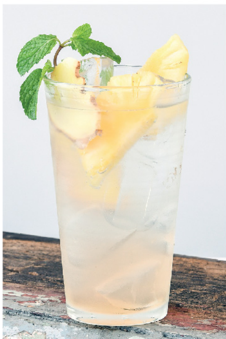
ขิงโซดา 95.- Ginger Syrup Soda