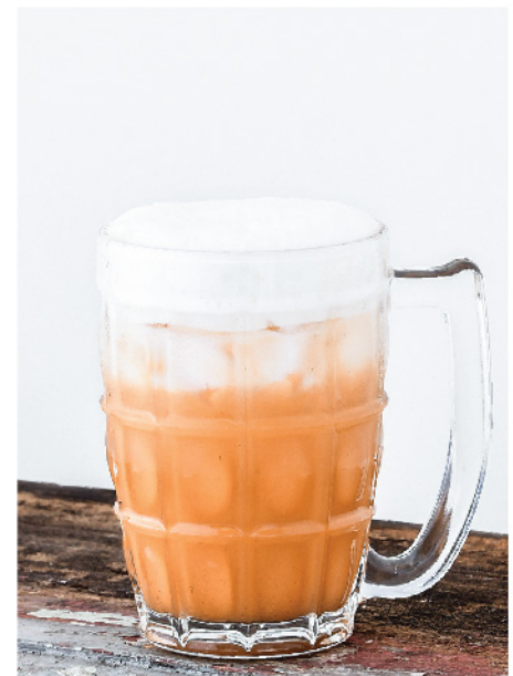
ชาไทยโบราณ 95.- Thai Milk Tea