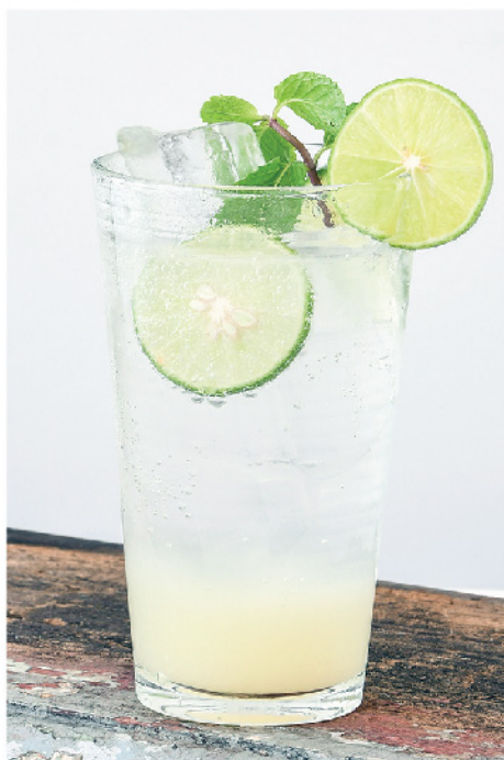
มะนาวโซดา 95.- Lime Soda