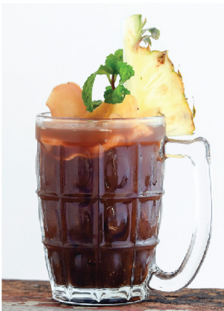
กาแฟเย็นจันทน์เฟอร์มสไตล์ 115.- Signature Ginger Farm Ice Coffee