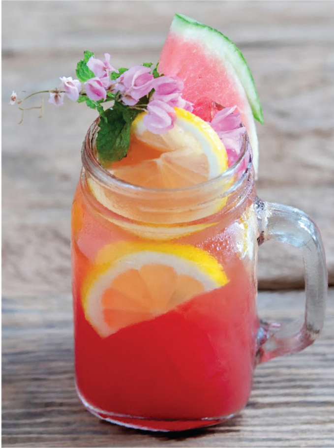
Rose Melody 150.- Rose Tea, Lemon, Lychee Syrup ชากุหลาบ, เลมอน, น้ำเชื่อมลิ้นจี่