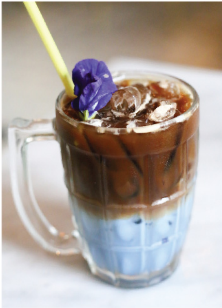
ลาเต้อัญชัน 115.- Butterfly Pea Latte