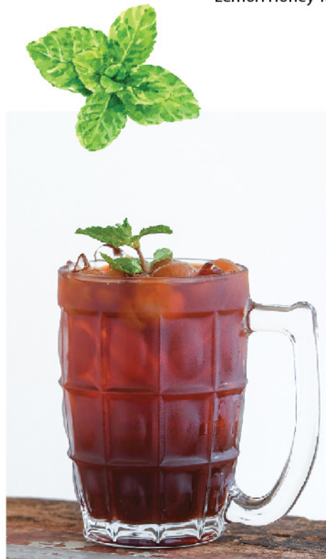
ชาไทยลำไย 115.- Thai Tea with Dried Longan