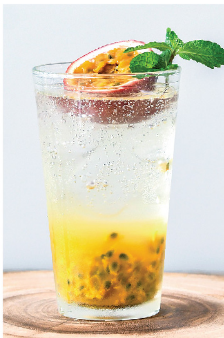
เสาวรสโซดา 95.- Passion Fruit Soda