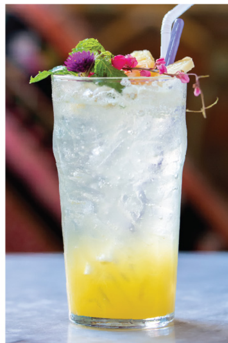
สับปะรดโซดา 95.- Pineapple Syrup Soda