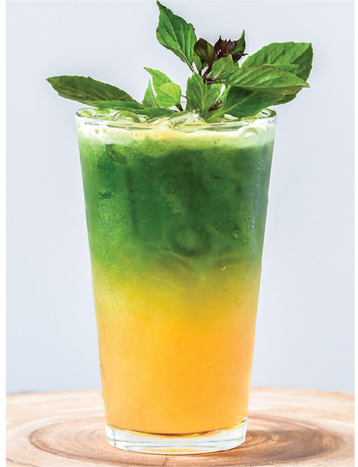
Pineapple Basil Cooler 175.- Coconut Green Tea, Pineapple, Holy Basil, Kale, Cucumber, Honey ชาเขียวมะพร้าว, สับปะรด, โหระพา, คะน้า, แตงกวา, น้ำผึ้ง