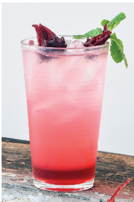
กระเจี๊ยบโซดา 95.- Rosella Syrup Soda