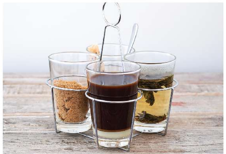
กาแฟจินเจอร์ฟาร์มสไตล์ Ginger Farm Coffee 120.-

Please advise our service staff for any allergies and / or dietary requirements. (Prices are subject to 10% service charge)