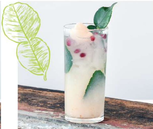
Lychee Mojito Bangyikhan, Malibu, Lychee Puree, Lime juice, Kaffir lime, White Sugar, Sprite 200.-