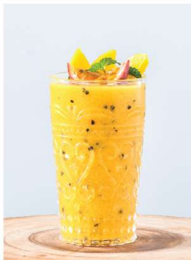
Refreshing Summer (Mango, Passion Fruit, Honey / มะม่วง, เสาวรส, น้ำผึ้ง) Boost antioxidant & immunity / เพิ่มสารต้านอนุมูลอิสระ และภูมิคุ้มกัน