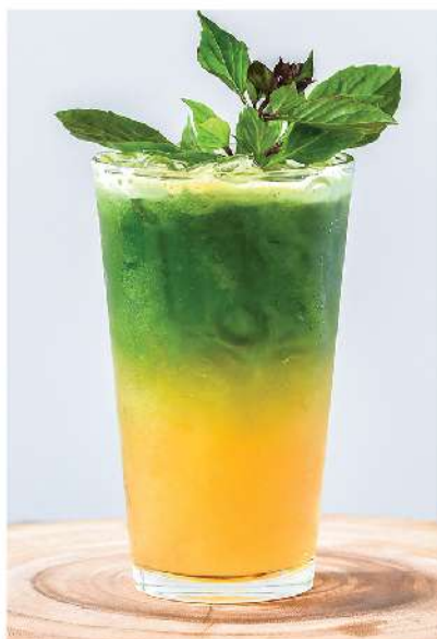
Pineapple Basil Cooler (Coconut Green Tea, Pineapple, Holy Basil, Kale, Cucumber, Honey / ชาเขียวมะพร้าว, สับปะรด, โหระพา, คะน้า, แตงกวา, น้ำผึ้ง) Boost Immunity & Reduce Stress / เพิ่มภูมิคุ้มกัน และลดความเครียด