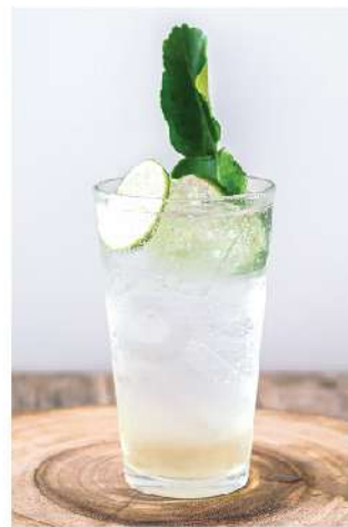
มะกรูดโซดา Kaffir Lime Syrup Soda 85.-