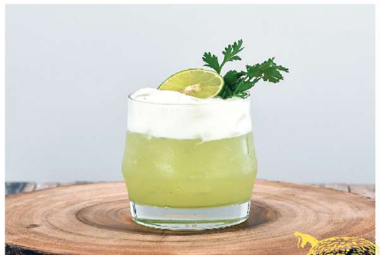
Ramayana Mekhong, Lemongrass, Kaffir Lime Syrup, Lime Juice, White Egg Kaffir lime, Coriander 180.-