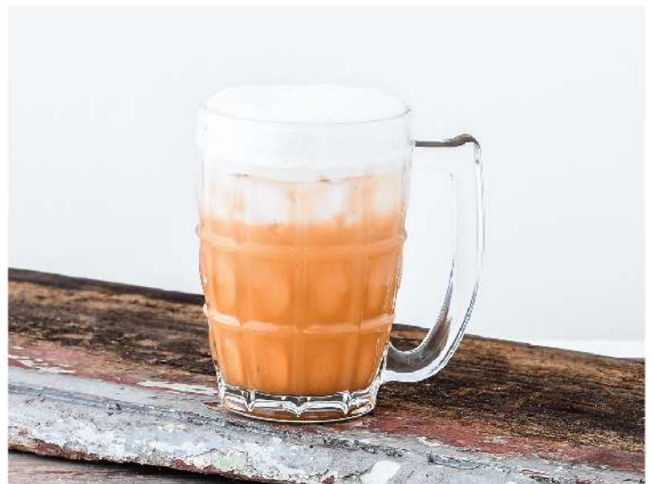
ชาไทย Thai Milk Tea 80.-