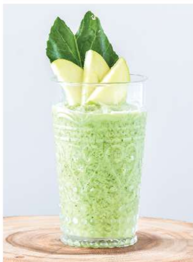
Super Start (Green Apple, Kale, Honey, Yogurt / แอปเปิ้ลเขียว, คะน้า, น้ำผึ้ง, โยเกิร์ต) Regulate Blood Glucose & Control weight / ควบคุมน้ำตาลกลูโคสในเลือด และควบคุมน้ำหนัก