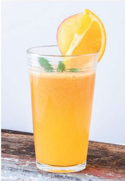
C-Mixed (Orange, Apple, Lime, Honey / ส้ม, แอปเปิ้ล, มะนาว, น้ำผึ้ง) Boost heart health & lower the risk of diseases / เสริมสุขภาพหัวใจลดความเสี่ยงของโรค