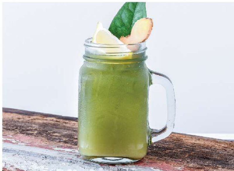
Jazz Up (Tiliacora Triandra juice, Ginger, Lime, Honey, Soda / น้ำโหย่านาง, ชিং, มะนาว, น้ำผึ้ง, โซดา) Natural Detoxification / ส่างพิษตามธรรมชาติ