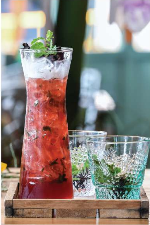
Roselle Summer (For Two) Mekhong, Roselle syrup, lime juice and mint leaf 290.-