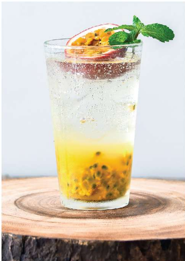
เสาวรสโซดา Passion Soda 85.-