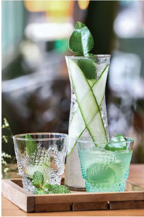
Forest Green (For Two) Bangyikhan, Kaffir lime syrup, lime juice, mint and cucumber 290.-