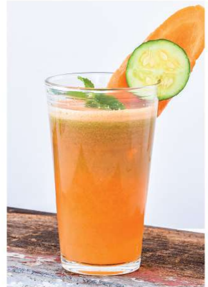
Bright Up (Centella Asiatica, Guava, Carrot, Lime / โใบัวบวท, ฟรุ้ง, แครอท, มะนาว) Cures Skin Diseases & Prevent premature aging / รักษาโรคผิวหนัง และป้องกันริ้วรอยก่อนวัย