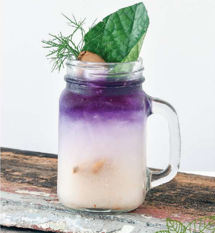
Ginger Farm Sling Ginger Vodka, Fresh Ginger, White Sugar, Lychee, Butterfly Pea Juice, Lime Juice, Sprite 250.-