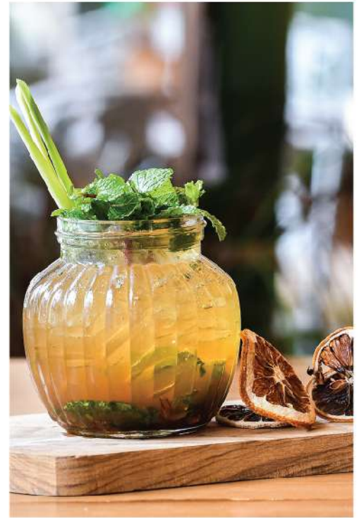
Phraya Herby Phraya, Mekhong, lime, mint leaf, Brown sugar, soda 250.-