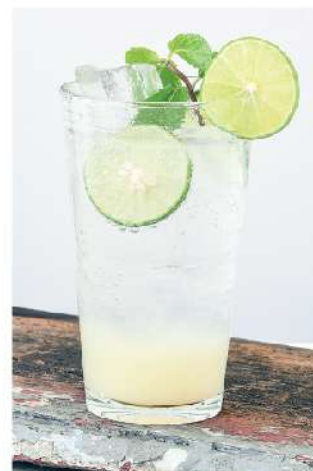
มะนาวโซดา Lime Soda 85.-