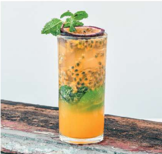
Passion fruit Mojito Bangyikhan, Lime, Mint, Passion Fruit, White Sugar, Sprite 200.-