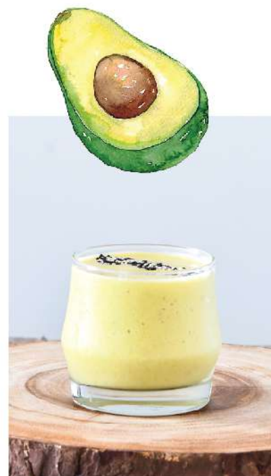
Avocado Banana Bravo 150.- (Avocado, Banana, Honey / อะโวกาโด, กล้วย, น้ำผึ้ง) Help digestive, Reconstruction & Maintain Healthy Skin / ช่วยย่อยอาหาร ต้านการอักเสบ บำรุงผิวพรรณ

Mango Tango (Mango, Pineapple, Orange, Strawberry Puree / มะม่วง, สับปะรด, ส้ม, สตรอเบอร์รี่) Rich in Vitamin C,A & Maintain Healthy Skin / อุดมไปด้วยวิตามินซี และเอ ช่วยบำรุงผิวพรรณ