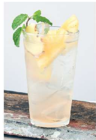
ขิงโซดา Ginger Syrup Soda 85.-