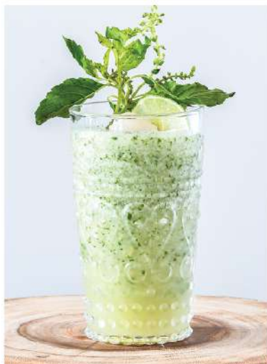
Lychee Mellow (Lychee Puree, Thai Basil, Ginger, Lime, Honey / ซอสลิ้นจี่, โหระพา, ชিং, มะนาว, น้ำผึ้ง) Improve blood circulation & metabolism / ช่วยเพิ่มการไหลเวียนโลหิต และเมตาบอลิซึม