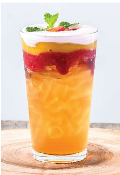
Pink Paradise (Tropical Tea, Mango Ppuree, Strawberry Ppuree, Honey, Strawberry Foam / ชาผลไม้, ขอส้มม่วง, ขอสตรอเบอรี่, น้ำผึ้ง, โฟมสตรอเบอรี่) Boosts Brain Function & Reduces Hypertension / กระตุ้นการทำงานของสมอง และลดความดันโลหิตสูง