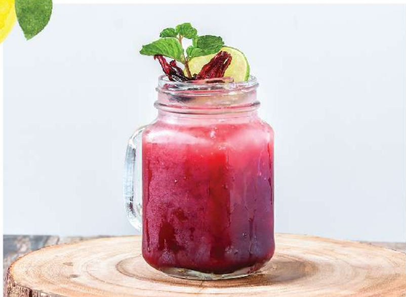
C-loaded (Rosella, Ginger, Lime, Honey, Soda / กระเจี๊ยบ, ชিং, มะนาว, น้ำผึ้ง, โซดา) Weight loss, relief cough & cold / ลดน้ำหนักและบรรเทาอาการไอและหวัด