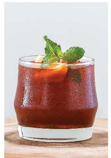
Mekhong Thai Tea Mekhong, Thai Red Tea, Fresh Lime Juice, Honey 180.-