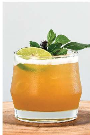
Thai Sabai Mekhong, Fresh Lime Juice, Honey, Thai Basil Leaves 180.-

Our cocktails are inspired by the herbs, fruit and vegetables that grow in our farm gardens. Using premium artisanal spirits often locally distilled they tell the story of the land and the seasons.