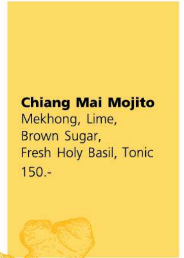
Chiang Mai Mojito Mekhong, Lime, Brown Sugar, Fresh Holy Basil, Tonic 150.-