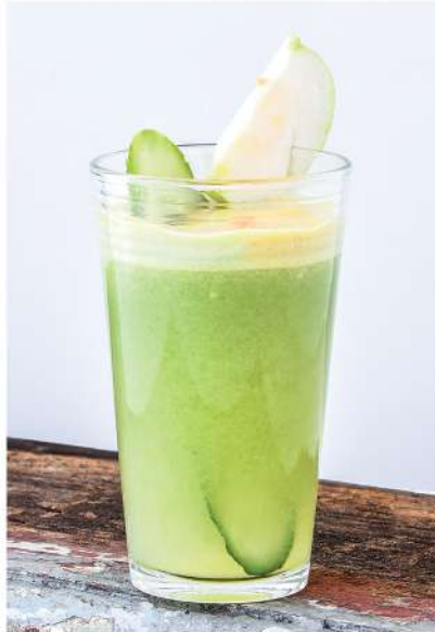
Juicy Guava (Cucumber, Apple, Guava, Ginger / แตงกวา, แอปเปิ้ล, ฟรุ้ง, ขิง) Improves Brain Health & Treats Cough & Cold / บำรุงสมอง และรักษาอาการไอและหวัด