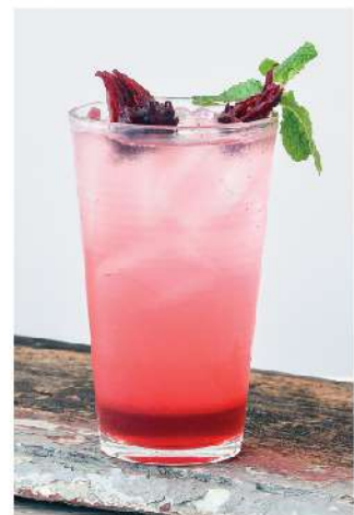
กระเจี๊ยบโซดา Rosella Syrup Soda 85.-

Please advise our service staff for any allergies and / or dietary requirements.