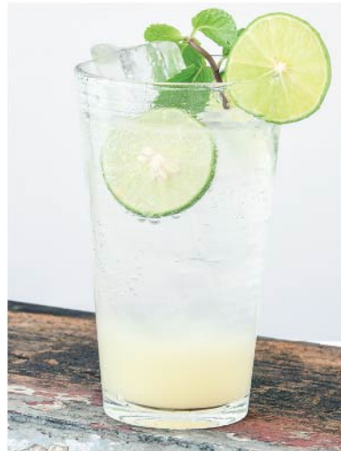
มะนาวโซดา 95.- Lime Soda