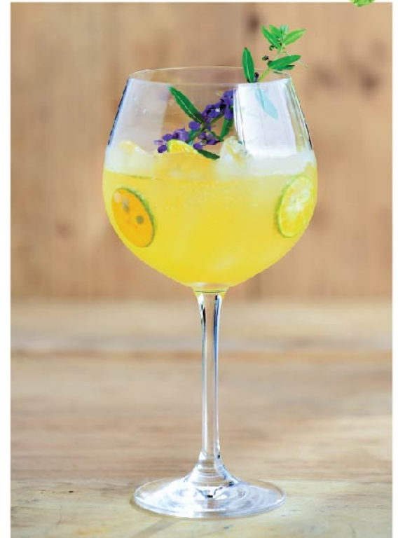
ส้มมะปี้ดโซดา 145.- Calamansi Soda

♥ High in Vitamin C, Stimulates improved digestion