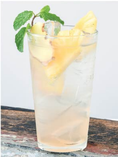
ขิงโซดา 95.- Ginger Syrup Soda