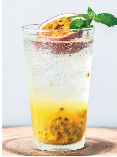
เสาวรสโซดา 95.- Passion Soda