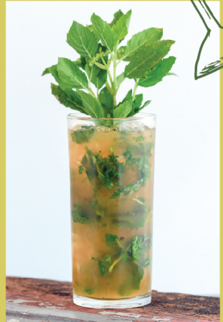
Chiang Mai Mojito 250.- / 180.- Mekhong, Lime, Brown Sugar, Fresh Holy Basil, Tonic