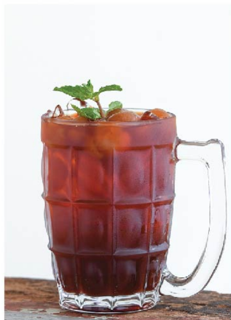
ชาไทยลำไย 115.- Thai Tea with Dried Longan