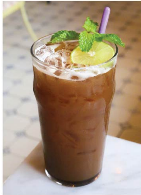
ไลม์เพรสโซ 115.- Limepresso