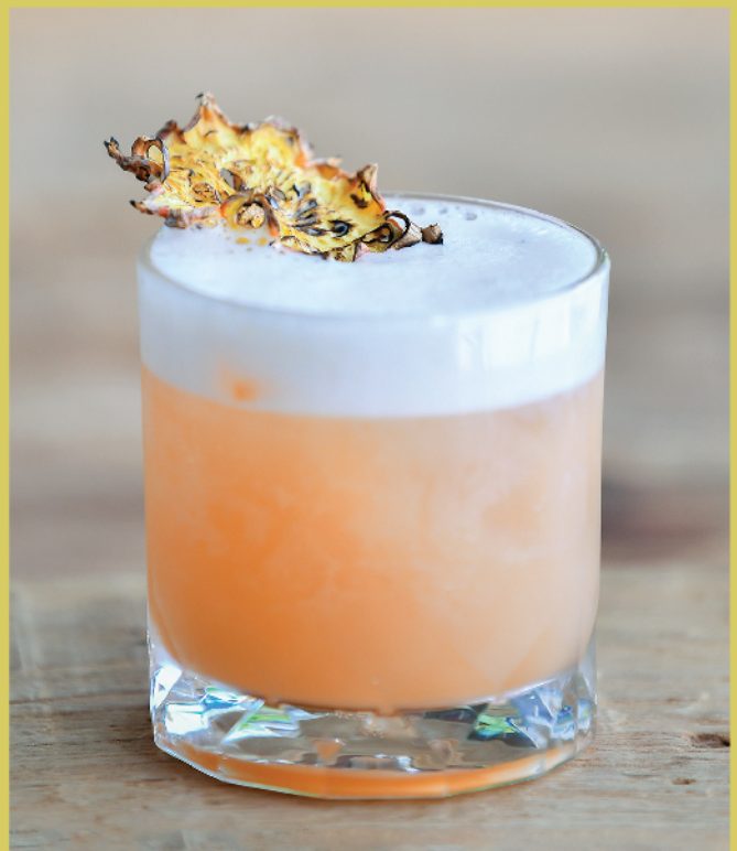
Pink Flamingo 320.- Kombucha original Pineapple juice, Lime juice, White rum

Please advise our service staff for any allergies and / or dietary requirements.