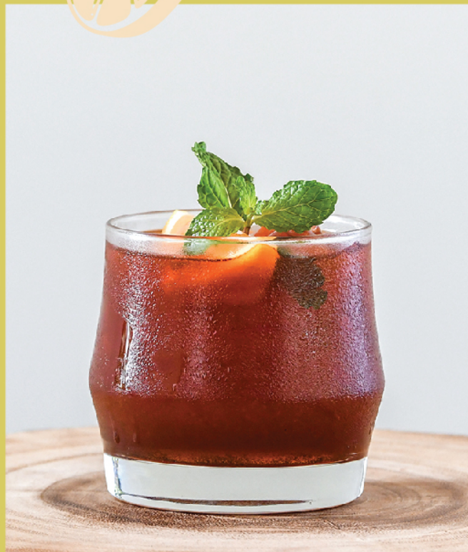
Mekhong Thai Tea 270.- / 190.- Mekhong, Thai Red Tea, Fresh Lime Juice, Honey