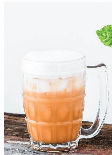
ชาไทยโบราณ 95.- Thai Milk Tea