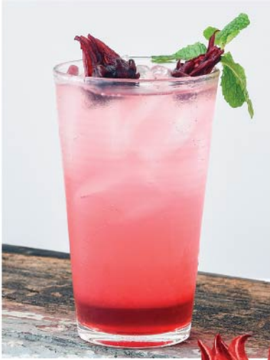
กระเจี๊ยบโซดา 95.- Rosella Syrup Soda