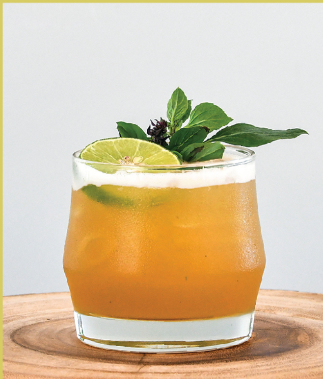
Thai Sabai 250.- / 190.- Mekhong, Fresh Lime Juice, Honey, Thai Basil Leaves