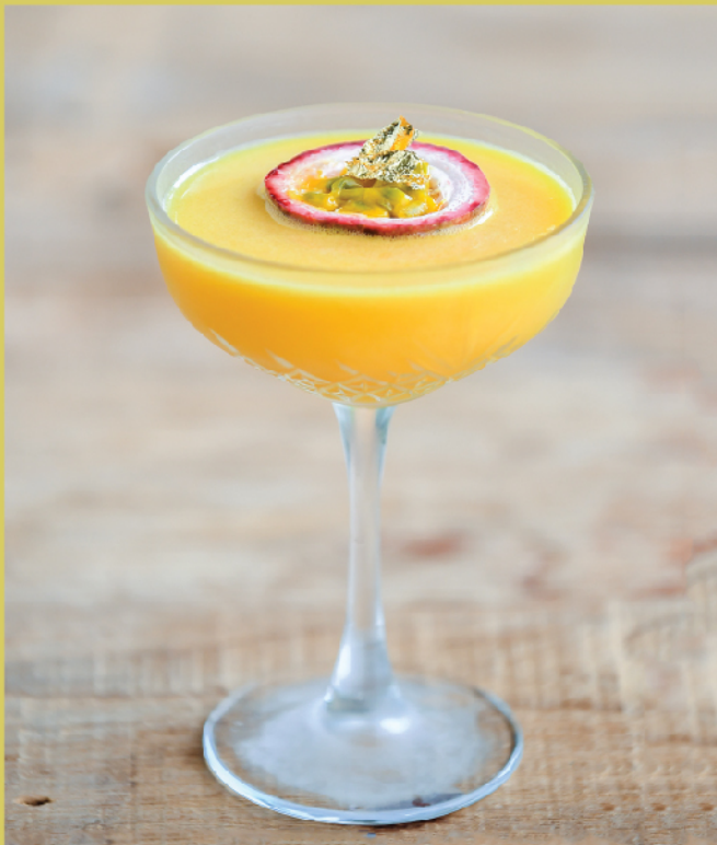
Summer Breeze 320.- passionfruit Kombucha Mango juice, White rum, Dark Rum