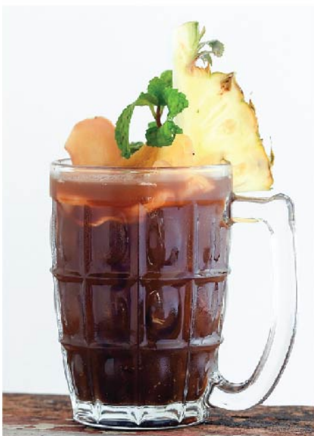
กาแฟเย็นจันทอร์ฟาร์มสโตร์ 115.- Signature Ginger Farm Ice Coffee