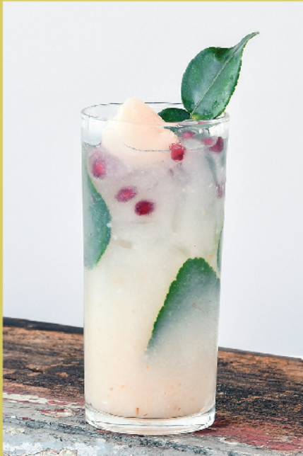
Lychee Mojito 270.- / 190.- Bangyikhan, Malibu, Lychee Puree, Lime juice, Kaffir lime, White Sugar, Sprite