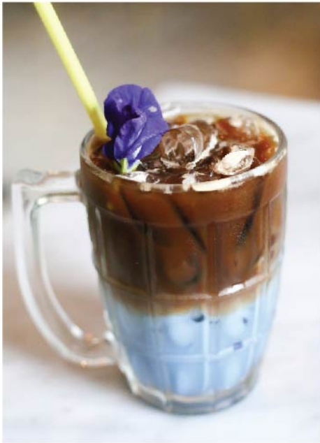
ลาเต้อัญชัน 115.- Butterfly Pea Latte

We proudly use Akha Ama coffee beans, originally grown in a sustainable way in orchards which are owned, tended and harvested by the Akha people of the village of Maejantai Chiang Rai