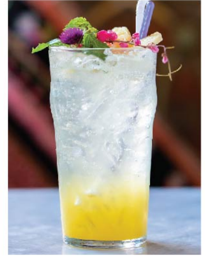
สับปะรดโซดา 95.- Pineapple Syrup Soda