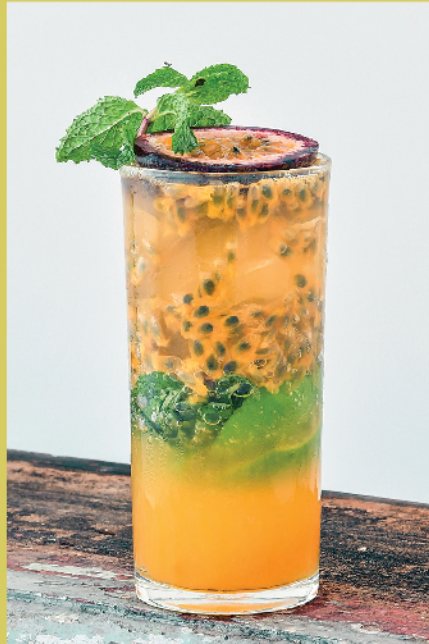
Passion fruit Mojito 270.- / 190.- Bangyikhan, Lime, Mint, Passion Fruit, White Sugar, Sprite