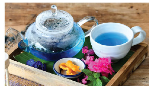
ชาอัญชัน Butterfly Pea Tea