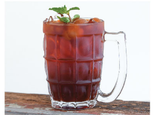
ชาไทยลำไย 90.- Thai Tea with Dried Longan