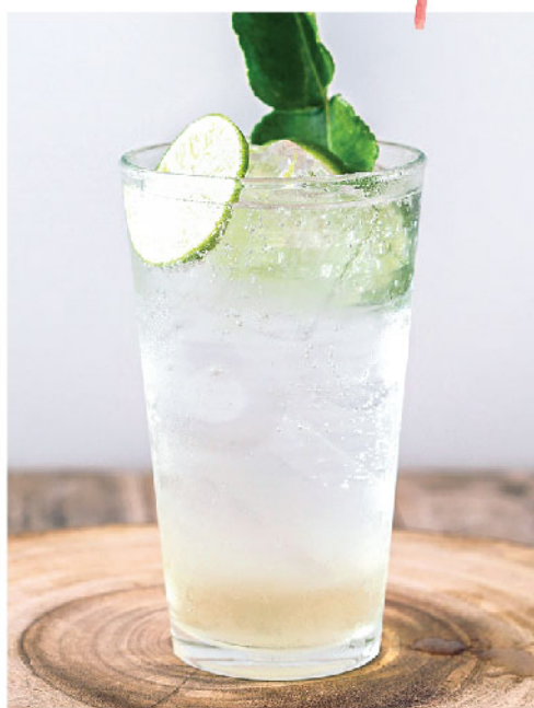
มะกรูดโซดา 95.- Kaffir Lime Syrup Soda