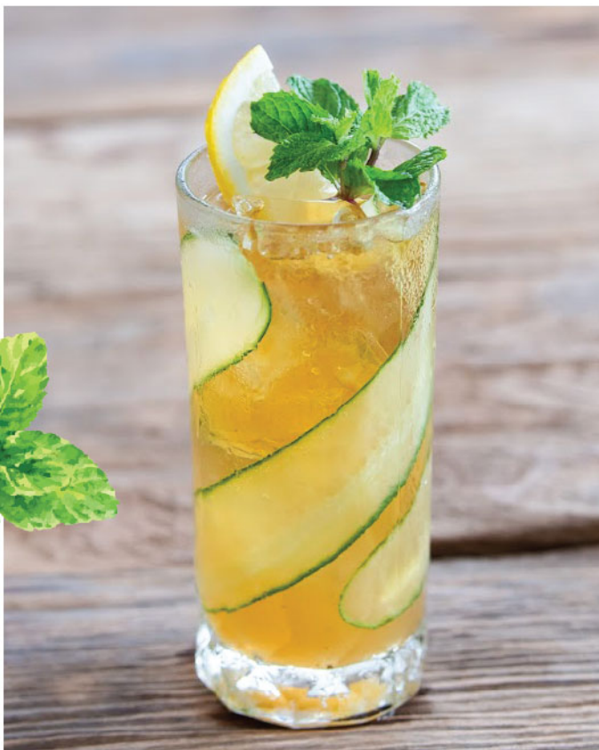
Tropical Sunset 135.- Tropical Tea, Lemon, Mint, Cucumber ชากลิ่นทรอปิคอล, เลมอน, ใบมินต์, แตงกวา

♥ Boost Immunity & Reduce Stress เพิ่มภูมิคุ้มกัน และลดความเครียด