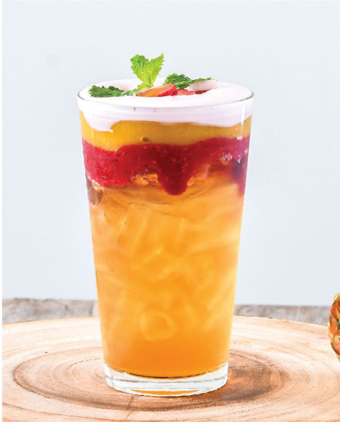
Pink Paradise 135.- Tropical Tea, Mango Puree, Strawberry Puree, Honey, Strawberry Foam ชาผลไม้, ซอสมะม่วง, ซอสสตอเบอร์รี่, น้ำผึ้ง, โฟมสตอเบอร์รี่

♥ Boosts Brain Function & Reduces Hypertension กระตุ้นการทำงานของสมอง และลดความดันโลหิตสูง