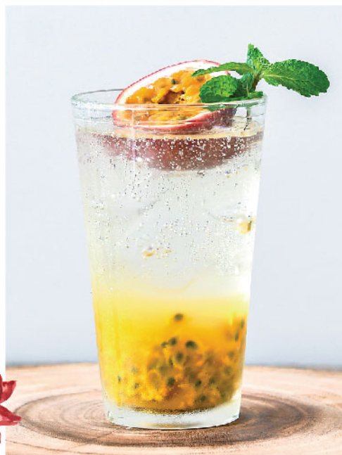
เสาวรสโซดา 95.- Passion Soda