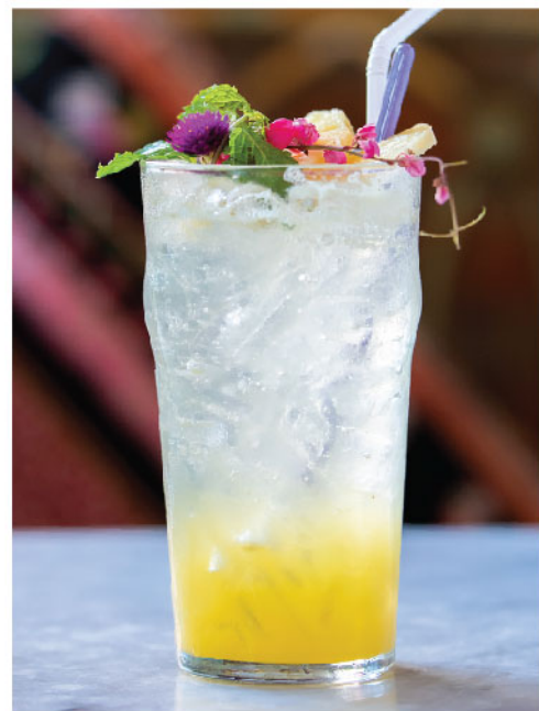
สับปะรดโซดา 95.- Pineapple Syrup Soda