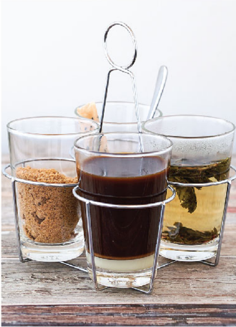
กาแฟจินเจอร์ฟาร์มสไตล์ 120.- Ginger Farm Coffee

We proudly use Akha Ama coffee beans, originally grown in a sustainable way in orchards which are owned, tended and harvested by the Akha people of the village of Maejantai Chiang Rai