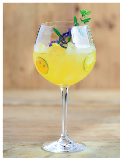
ส้มมะปี้ดโซดา 145.- Calamansi Soda ♥ High in Vitamin C, Stimulates improved digestion