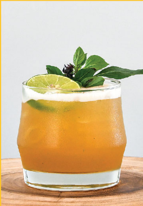
Thai Sabai 290.- / 190.- Mekhong, Fresh Lime Juice, Honey, Thai Basil Leaves