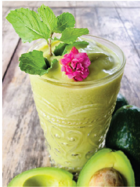
Avo Go-green 135.- Organic Avocado, Almond Milk, Fresh Milk, Honey