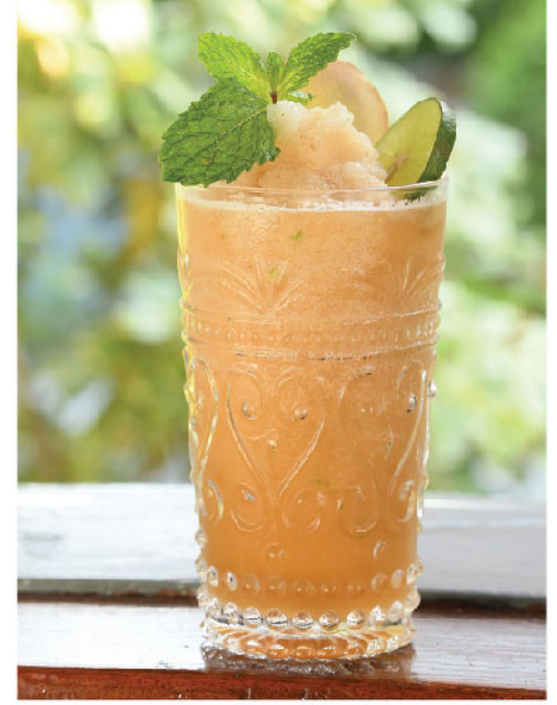
Ginger Farm Shake 135.- Ginger, Lime, Honey, Ginger ale ชিং, มะนาว, น้ำผึ้ง, จินเจอร์ออล