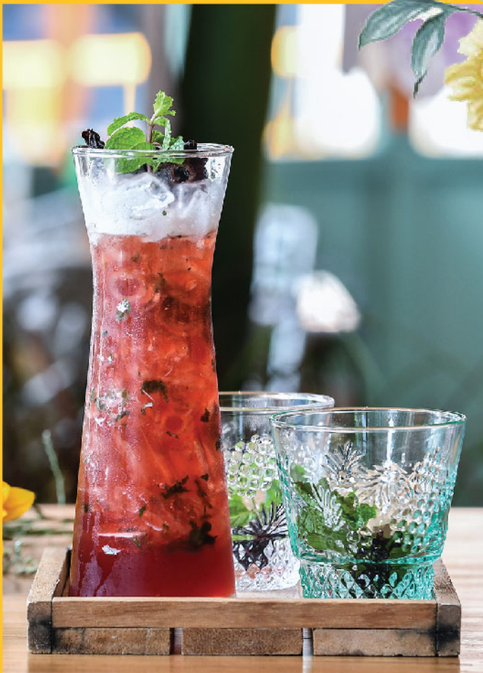
Roselle Summer (For Two) 390.- Mekhong, Roselle syrup, lime juice and mint leaf