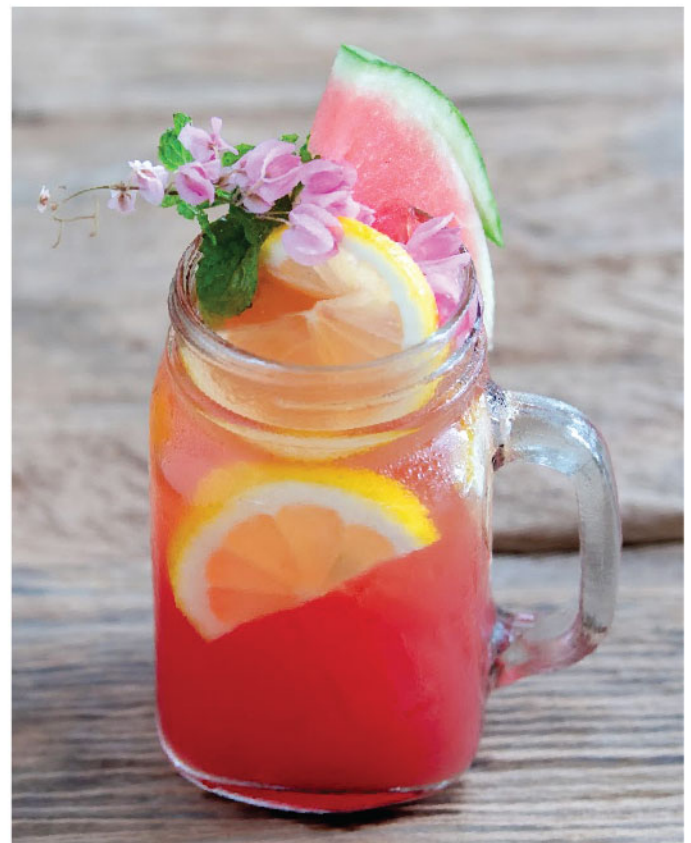
Rose Melody 135.- Rose Tea, Lemon, Lychee Syrup ชากุหลาบ, เลมอน, น้ำเชื่อมลิ้นจี่