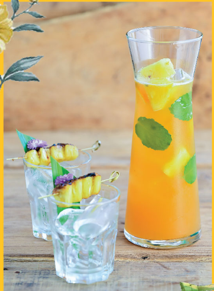
Royal Hawaiian (For Two) 490.- Mekhong, Angostura Bitters, Coconut Juice Pineapple Juice, Lime Juice, Syrup