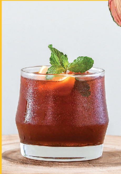
Mekhong Thai Tea 290.- / 190.- Mekhong, Thai Red Tea, Fresh Lime Juice, Honey