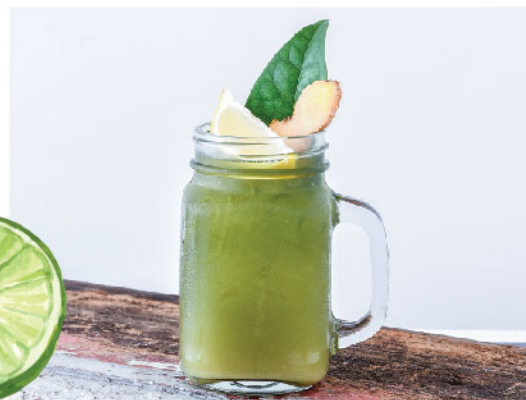
Jazz Up 135.-

Tiliacora Triandra juice, Ginger, Lime, Honey, Soda