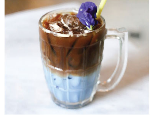
ลาเต้อัญชัน 100.- Butterfly Pea Latte