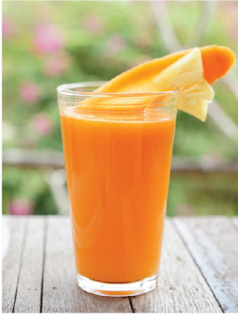
Carrotly 135.- Carrot, Orange, Pineapple แครอท, ส้ม, สับปะรด