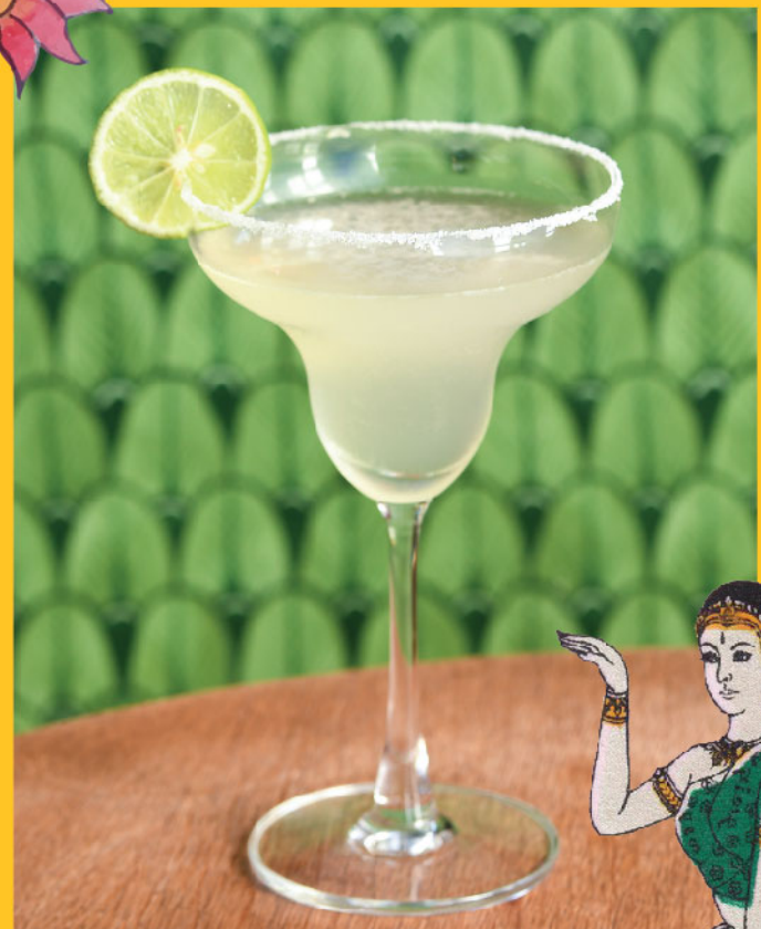
Margarita 290.- Tequila, Tripple sec, Lime juice, Syrup