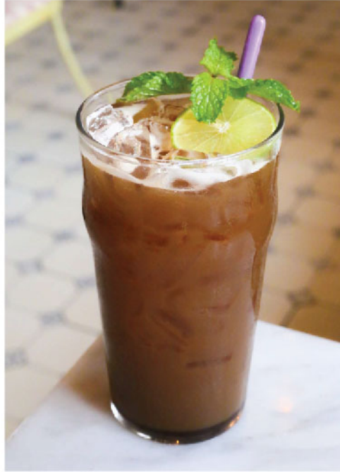
ไลม์เพรสโซ 100.- Limepresso