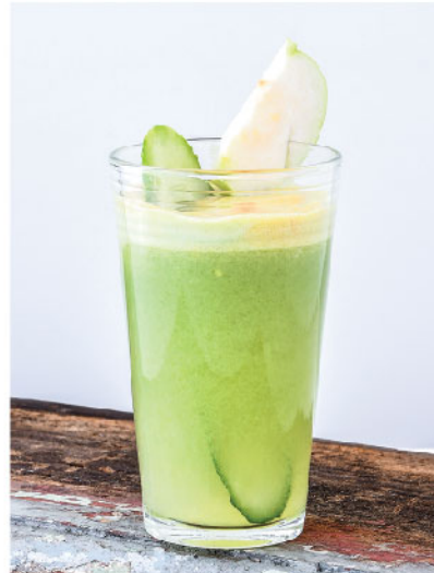
Juicy Guava 135.- Cucumber, Apple, Guava, Ginger แตงกวา, แอปเปิ้ล, ฝรั่ง, ขิง