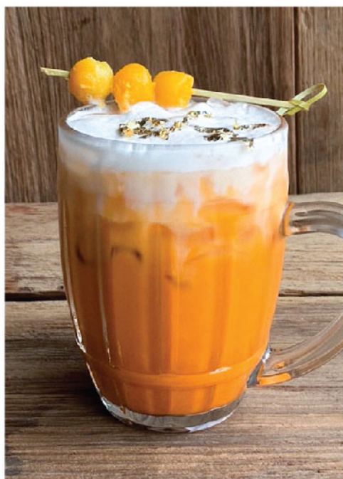
ชาไทยโบราณ 135.- Thai Milk Tea