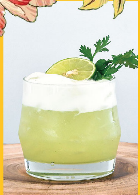
Ramayana 290.- / 190.- Mekhong, Lemongrass, Kaffir Lime Syrup, Lime Juice, White Egg Kaffir lime, Coriander