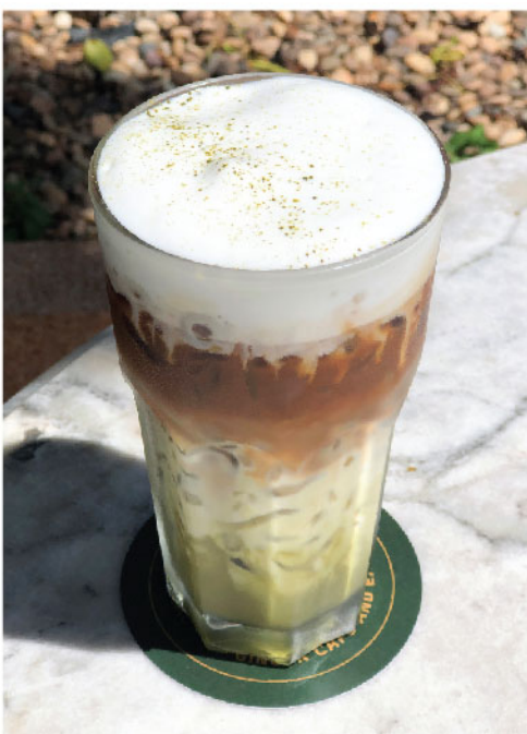
กาแฟมัทฉะ 100.- Matcha Espresso