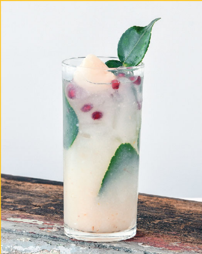
Lychee Mojito 290.- / 190.- Bangyikhan, Malibu, Lychee Puree, Lime juice, Kaffir lime, White Sugar, Sprite