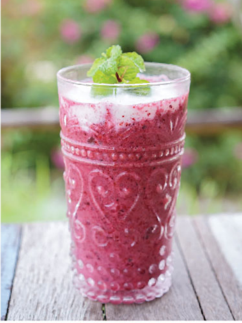
Mixed Berries Yogurt 135.- Mixed Berries, Yogurt ติกซ์เบอร์รี่, โยเกิร์ต