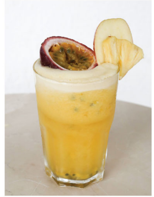
Bali Lush 135.- Passion Fruit, Apple, Pineapple แตงกวา, เสาวรส, แอปเปิ้ล, สับปะรด