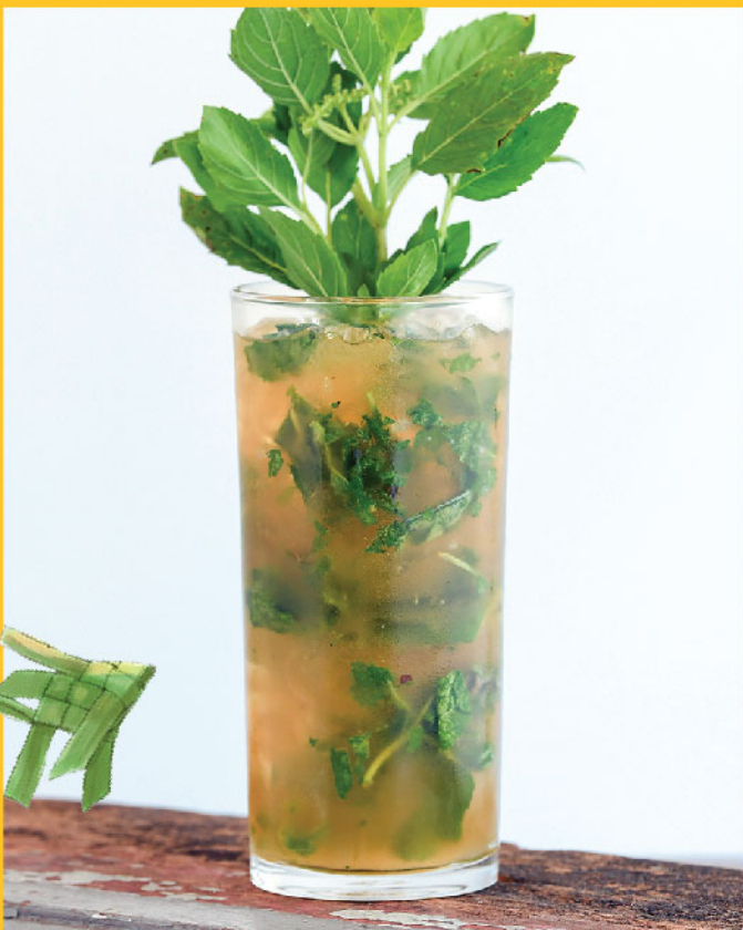
Chiang Mai Mojito 290.- / 190.- Phraya Elements Rum, Lime, Brown Sugar, Fresh Holy Basil, Tonic