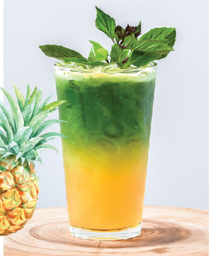
Pineapple Basil Cooler 135.- Coconut Green Tea, Pineapple, Holy Basil, Kale, Cucumber, Honey ชาเขียวมะพร้าว, สับปะรด, โหระพา, คะน้า, แตงกวา, น้ำผึ้ง

♥ Boosts Brain Function & Reduces Hypertension กระตุ้นการทำงานของสมอง และลดความดันโลหิตสูง