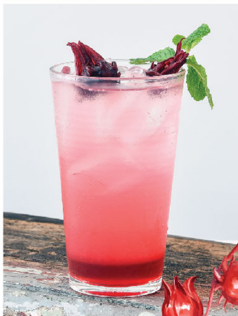
กระเจี๊ยบโซดา 95.- Rosella Syrup Soda