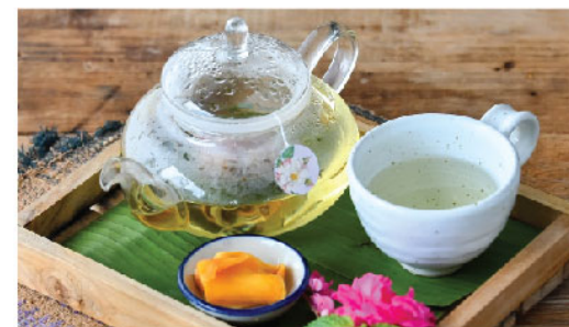
ชาต้มยำ Tom Yum Tea