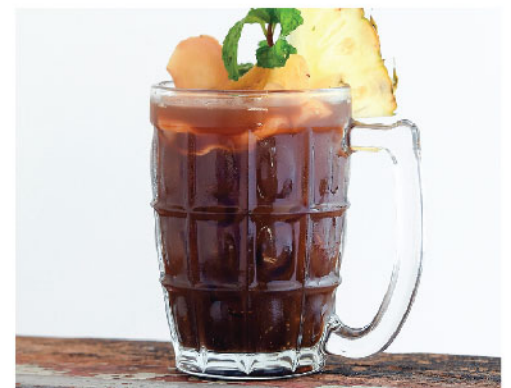
กาแฟเย็นจินเจอร์ฟาร์มสไตล์ 90.- Signature Ginger Farm Ice Coffee