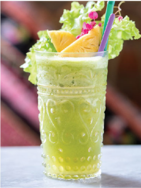
สับปะรดกรีนโอ๊คปั่น 135.- Pineapple and Green Oak Lettuce Smoothie