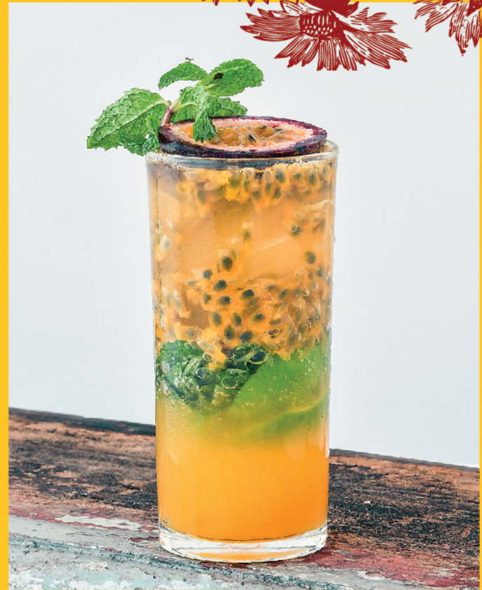
Passion fruit Mojito 290.- / 190.- Bangyikhan, Lime, Mint, Passion Fruit, White Sugar, Sprite