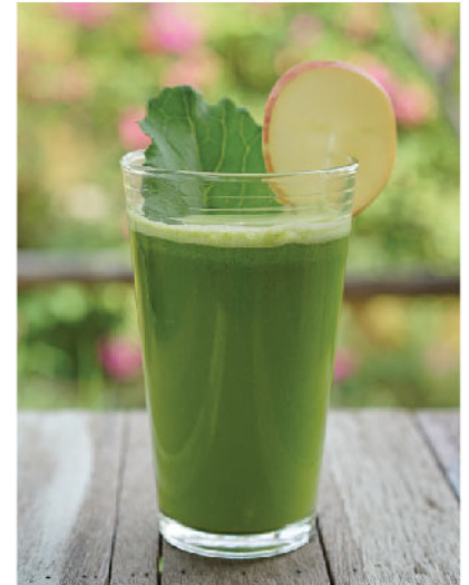
My Green 135.- Celery, Apple, Pineapple, Kale คื่นช่าย, แอปเปิ้ล, สับปะรด, กะนํ้า