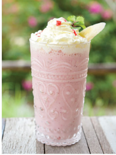
Pink Cow 135.- Banana, Strawberry Puree, Vanilla Sauce, Milk กล้วย, สตอเบอร์รี่, วนิลา, นมสด