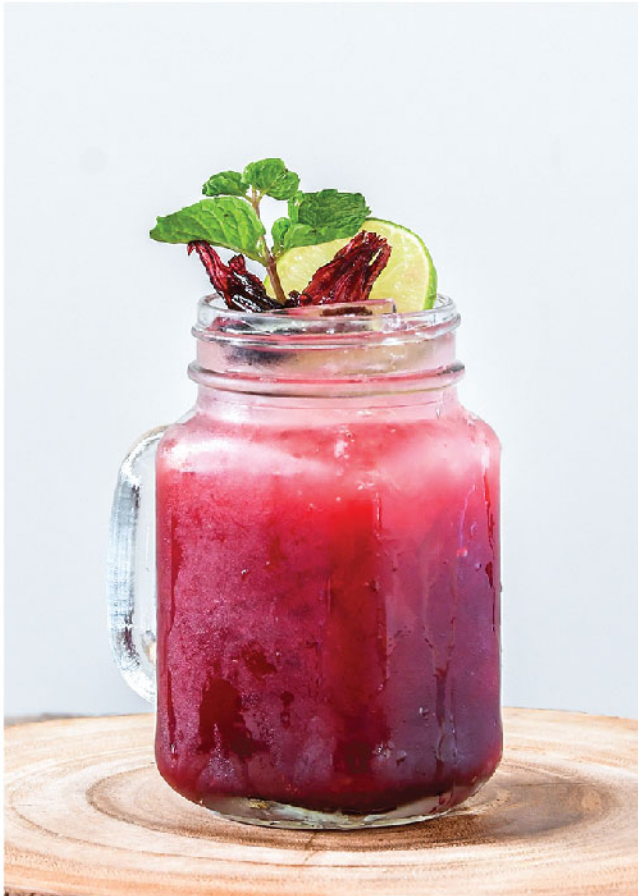
C-loaded 135.- Rosella, Ginger, Lime, Honey, Soda / กระเจี๊ยบ, ขิง, มะนาว, น้ำผึ้ง, โซดา