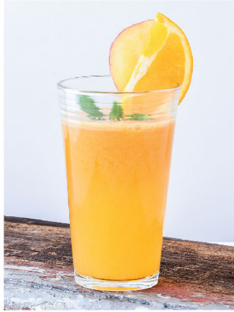
C-Mixed 135.- Orange, Apple, Lime, Honey ส้ม, แอปเปิ้ล, มะนาว, น้ำผึ้ง